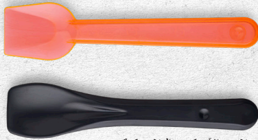
ملعق الأيس كريم البلاستيكية