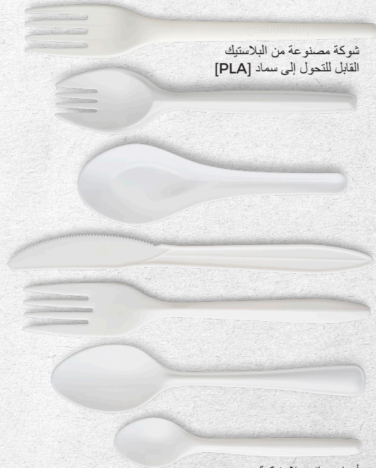
شوكة مصنوعة من البلاستيك القابل للتحويل إلى سماد [PLA]